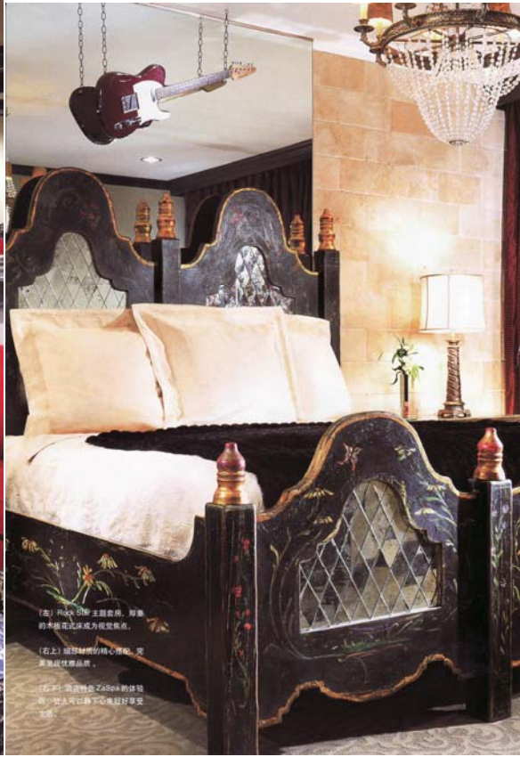
【左】Rock & Roll 主题套房，形象 的木框花镜成为视觉焦点。 【右上】超群雕饰的核心景观，突 显奢华品质。 【右下】酒店特色 Zebra 的休憩 房，让人可以躺下也能好好享受 生活。